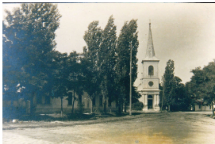
Unitárius templom az iskolával